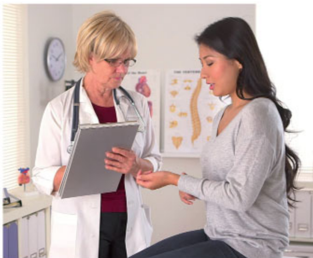
La consulta temprana ante el inicio de los síntomas es de vital importancia.

Cuando el médico se encuentre ante el diagnóstico de prolapso y desee conocer el grado del mismo, solicitará un estudio de resonancia magnética (RM) a fin de confirmar el mismo, caracterizarlo y clasificarlo.