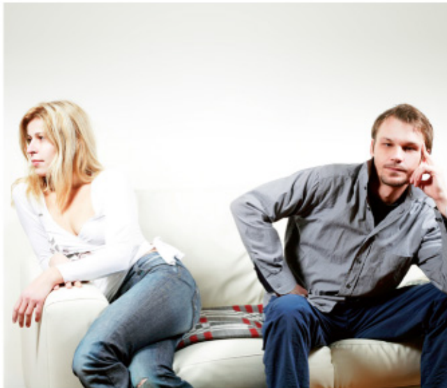
Sentir enojo por determinada situación puede que no sea bien recibido por quien lo siente, y mucho menos por quien se encuentra en frente.

Teniendo en cuenta que la tierra es llamada 'la escuela de las emociones', bienvenidos sean aquellos sentimientos que hacen que aquella experiencia con cierta carga emocional no sea simplemente una experiencia más y podamos así dejarla archivada en nuestro historial de recuerdos. |