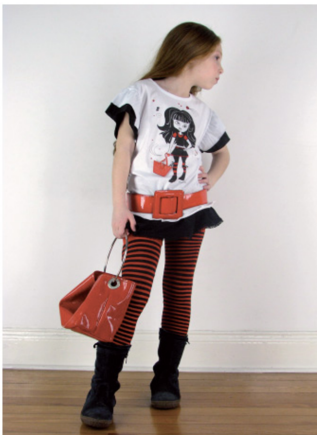
Actualmente se puede apreciar un cambio en el vestir de algunas niñas que eligen simular ser mayores.

A lo largo de los años, las tendencias en moda y vestimenta fueron cambiando. Actualmente se puede apreciar